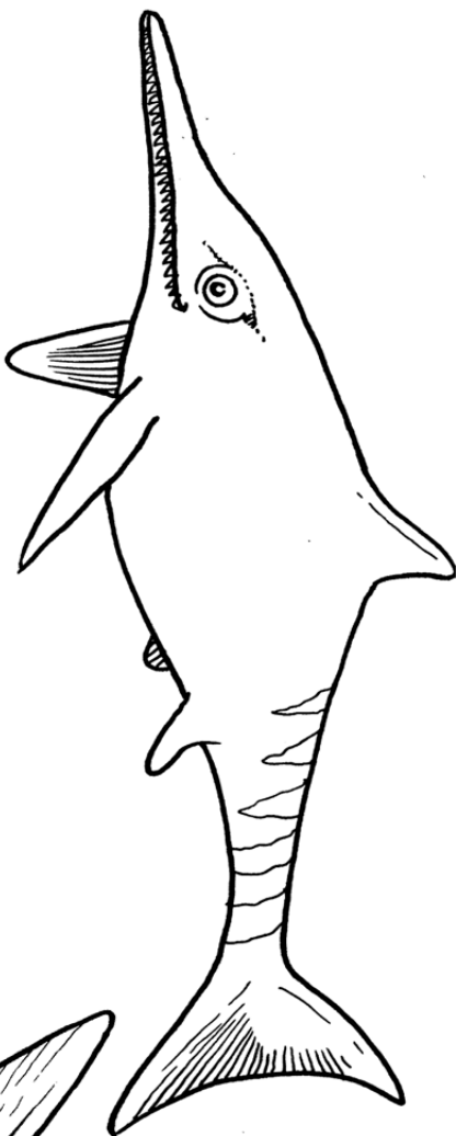
Ichthyosaurus (2 m)

Ichthyosaurus var en utveckling av de havslevande reptiler som dök upp under Trias. Den simmade troligen som nutida delfiner och jagade fisk och skaldjur. Den har gett namn åt släktet ichtyosaurier.